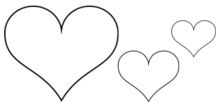
TABLEAU DE MOTIVATION DES PETITS COEURS